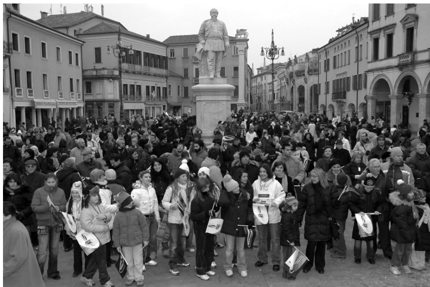
Piazza Vittorio Emanuele II gremita prima dell'arrivo della fiaccola Olimpica

cittadini, alla volontà dell'amministrazione pubblica, del Coni e delle organizzazioni sportive locali, è stato possibile organizzare questo importante appuntamento. Era questo il trentottesimo giorno di viaggio della fiamma olimpica che ha toccato tutte le regioni e province italiane, nel suo tragitto da Mantova passando per Ferrara, diretta a