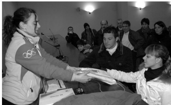
La consegna delle tute e dei numeri di pettorale ai tedofori che di lì a poco prenderanno parte all'evento