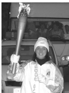
Qui sopra La campionessa del mondo di pattinaggio a rotelle Marika Zanforlin