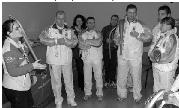
Le ultime istruzioni prima della partenza